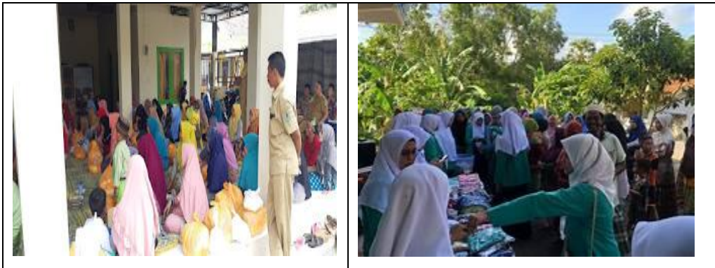
Gambar 2. Sosialisasi dan pelatihan Literasi

Diskusi interaktif juga mewarnai kegiatan ini, antusiasme pelaku usaha sebagai peserta terlihat sangat jelas dari partisipasi aktif mereka dalam mengajukan pertanyaan, sehingga terdapat berbagi pengalaman usaha, serta menganggapi materi yang disampaikan oleh tim PKM. Suasana ini membentuk proses belajar yang dinamis dan memfasilitasi timbal balik tim PKM di antara para peserta