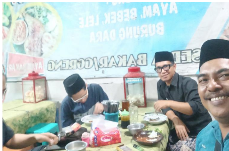
Dokumentasi di salah satu UKM

Luaran kegiatan PKM ini didukung oleh dokumentasi berupa foto kegiatan pelatihan dan pendampingan, tabel hasil pre-test dan post-test, serta contoh buku kas sederhana yang digunakan peserta. Penyajian data dalam bentuk tabel dan grafik mempermudah analisis tingkat peningkatan pengetahuan dan keterampilan peserta. Dokumentasi ini memperkuat validitas hasil PKM dan dapat digunakan sebagai bukti capaian kegiatan.