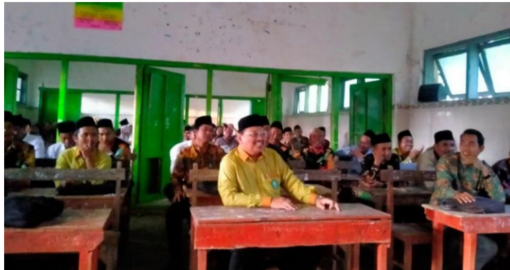
Gambar 1.7 Strategi Keberlanjutan dan Komitmen Bersama

Forum Kelompok Dampingan ini memiliki peran strategis sebagai penggerak perubahan yang berkelanjutan. Keberadaannya sangat penting karena difasilitasi langsung oleh pelaku pendidikan di tingkat akar rumput, sehingga memiliki kedekatan dan pemahaman kontekstual yang mendalam terhadap kebutuhan dan kondisi madrasah di wilayah kepulauan Raas. Melalui jejaring ini, madrasah dapat menjaga ritme evaluasi dan pengembangan mutu secara berkesinambungan, tanpa bergantung sepenuhnya pada intervensi eksternal.