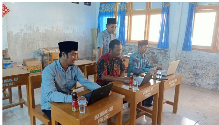
Gambar 1.6 Pendampingan Lapangan

Kemampuan peserta untuk mengisi instrumen EDM secara tepat waktu dan akurat meningkat pesat. Peserta mulai mampu melakukan analisis hasil evaluasi dengan membedah data untuk menemukan area yang menjadi prioritas pengembangan. Dari hasil analisis ini, madrasah-madrasah telah mampu menyusun Rencana Tindak Lanjut (RTL) yang bersifat realistis, terukur, dan berorientasi pada solusi praktis. Beberapa madrasah telah merancang RTL sederhana yang berfokus pada peningkatan sarana pembelajaran, seperti perbaikan ruang kelas dan penyediaan perangkat pembelajaran berbasis teknologi. Terdapat pula program penguatan kompetensi guru melalui pelatihan internal dan workshop yang didesain sesuai kebutuhan temuan EDM (Warisno, A, 2017:22).