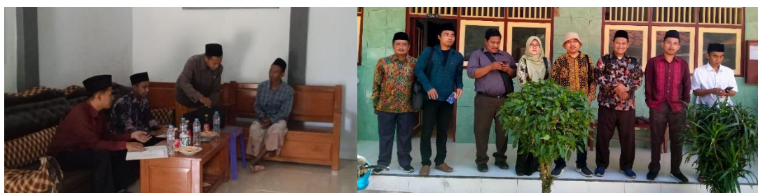
Gambar 1.5 Pendampingan Lapangan

Kholid, I., Chandra, M. R., Nurhadi, H., & Anwar, R. (2025:4) menyatakan Pendampingan langsung di lokasi madrasah menjadi fokus utama agar intervensi lebih kontekstual dan efektif. Tim pengabdian bersama Tim Inti Kabupaten secara rutin melakukan kunjungan ke madrasah-madrasah mitra untuk memberikan bimbingan intensif terkait pengoperasian platform EDM, klarifikasi indikator, serta pembinaan dalam menganalisis data yang terkumpul. Pendampingan ini bersifat personal dan adaptif, menyesuaikan dengan kemampuan dan kebutuhan masing-masing madrasah, serta memperhatikan kendala teknis seperti akses internet yang terbatas di beberapa lokasi.