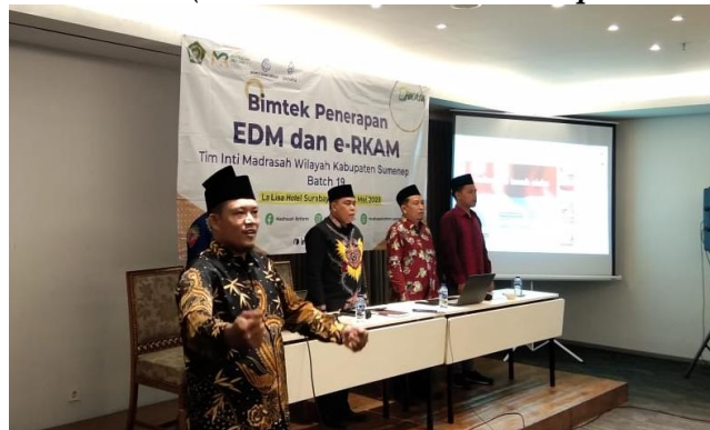
Gambar 1.2 Pelaksanaan Pelatihan

Tahap Define merupakan fase krusial di mana semua perencanaan dan desain intervensi mulai direalisasikan secara nyata di lapangan. Pada tahap ini, madrasah-madrasah mitra se Kecamatan Raas, mulai dari Madrasah Ibtidaiyah (MI) hingga Madrasah Aliyah (MA), menjalani serangkaian pelatihan teknis dan pendampingan langsung dalam pelaksanaan Evaluasi Diri Madrasah (EDM) berbasis elektronik. Kegiatan pelatihan teknis ini dilaksanakan dengan dukungan penuh dari Tim Inti Kabupaten Sumenep serta tim pengabdian dari perguruan tinggi.