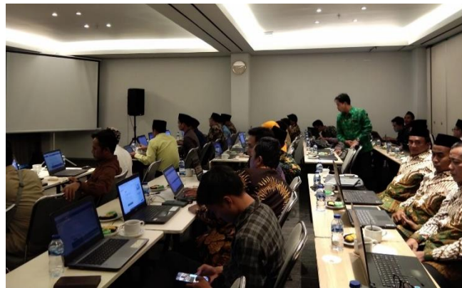
Gambar 1.4 Praktik Analisis Data dan Tindak Lanjut

Pelatihan tersebut mencakup pengisian data EDM oleh berbagai komponen madrasah, yaitu kepala madrasah, guru, siswa, dan komite madrasah (Suwarno, S. A,2023:7013). Pendekatan multisektor ini dirancang agar seluruh elemen madrasah memiliki pemahaman bersama mengenai proses evaluasi dan dapat berkontribusi dalam penyediaan data yang akurat dan lengkap. Dalam praktiknya, pengisian EDM dilakukan secara bertahap dan sesuai dengan jadwal yang telah disesuaikan untuk mengakomodasi waktu secara kolektif dari para guru dan staf madrasah, sehingga partisipasi aktif mereka dapat terjamin.